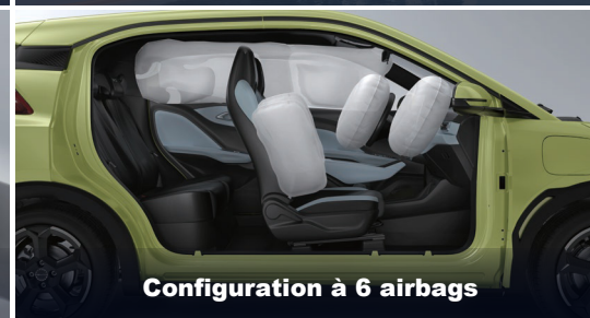
Configuration à 6 airbags