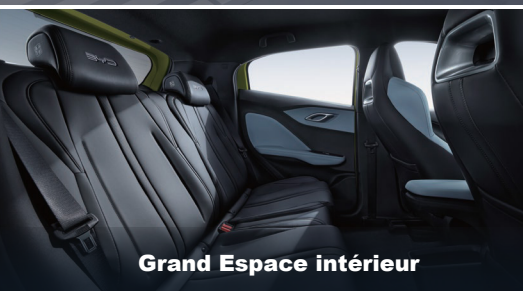
Grand Espace intérieur