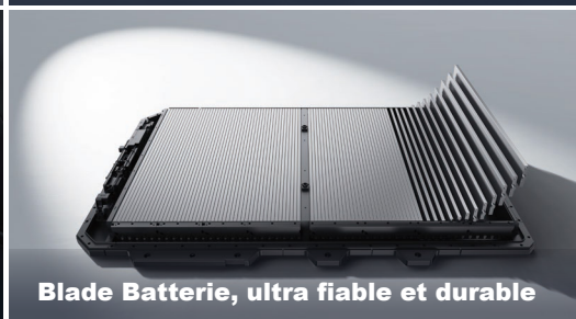
Blade Batterie, ultra fiable et durable